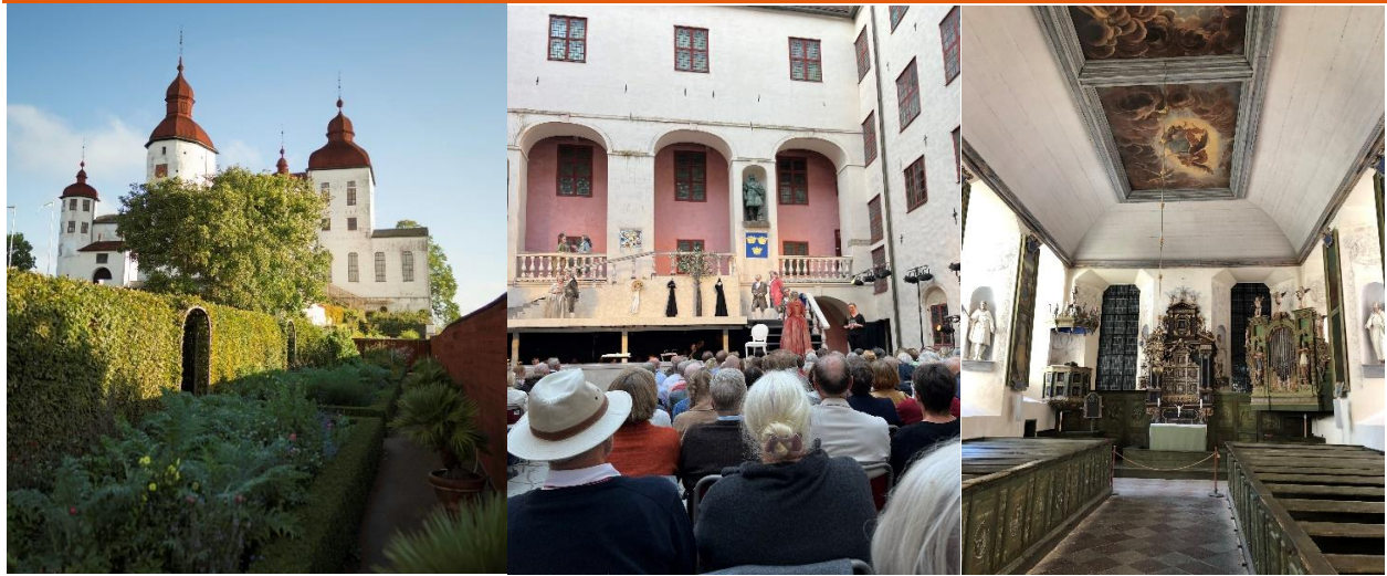
Foto: Läckö Slott exteriör